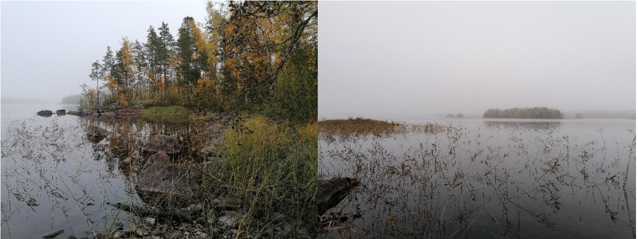
Siirtoalueen rantaa eli rakennuspaikan mahdollinen uusi sijainti